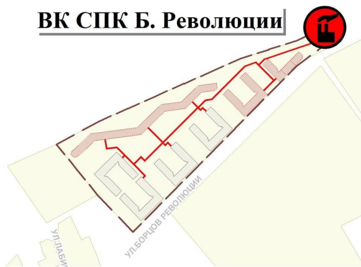
Рисунок 2 - Графическое отображение тепловых сетей, планируемых для строительства в период 1-го расчетного срока схемы теплоснабжения микрорайона по ул. Борцов Революции, 1а

Графическое отображение тепловых сетей, планируемых к строительству представлено на рисунке 2.