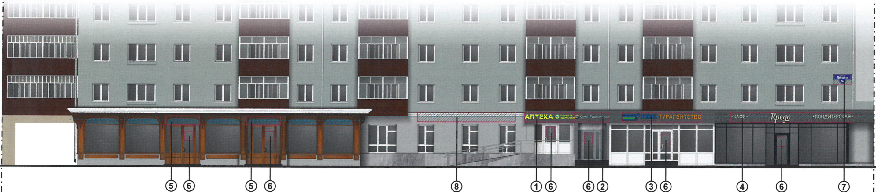
Ведомость размещения объектов городской информации