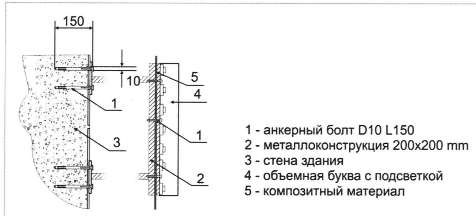
Узел крепления объекта городской информации

Управление архитектуры и градостроительного дизайна ДГА администрации г.Перми СООТВЕТСТВУЕТ АРХИТЕКТУРНОМУ ОБЛИКУ ГОРОДА ПЕРМИ Кардеев С.А. 12.2018