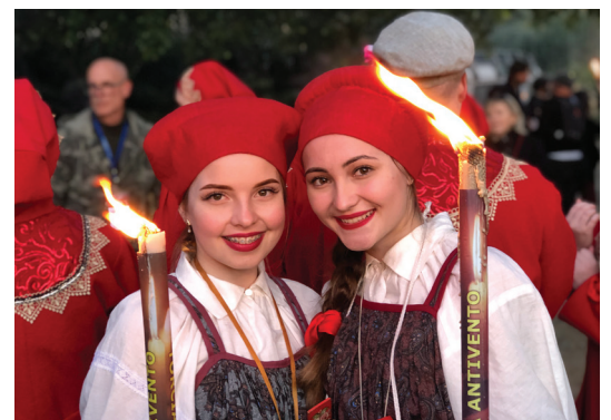
Яркими моментами фестиваля стали зажигание огня и многолюдное шествие с факелами дружбы по городским улицам и театрализованное финальное шоу у подножия храма Согласия в Долине Храмов