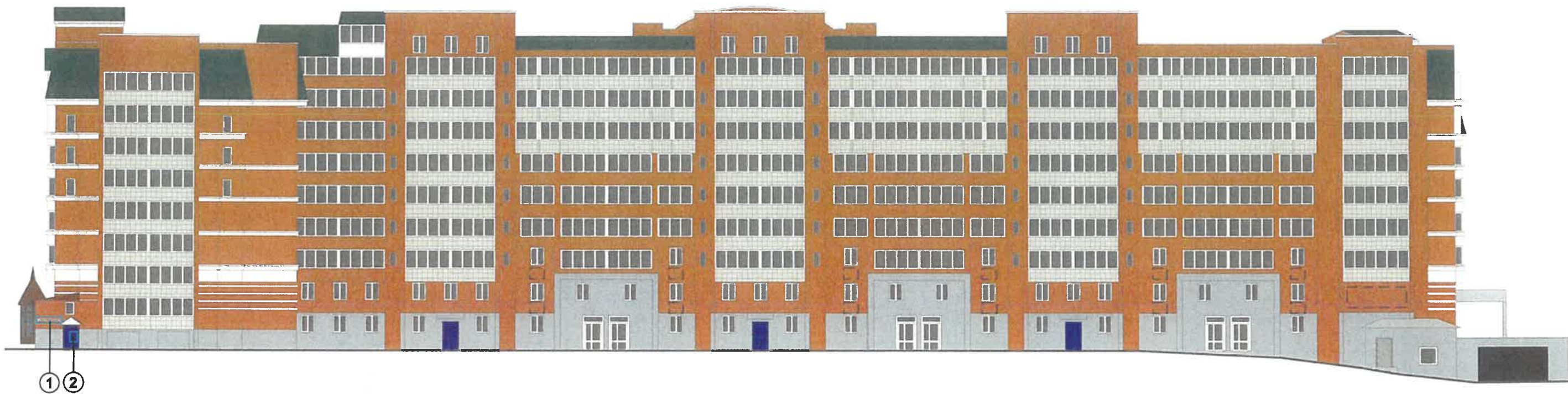
Узел крепления объекта городской информации