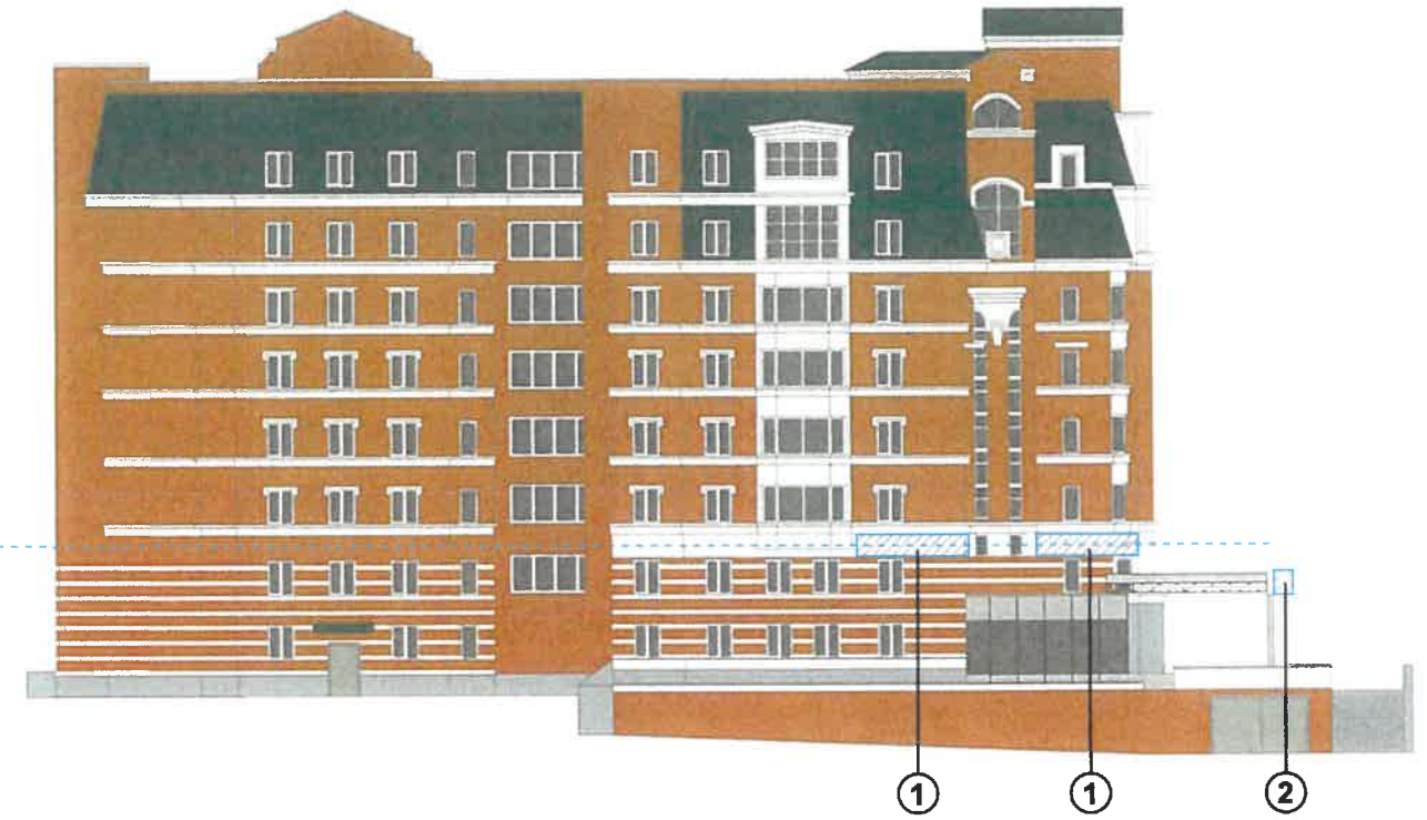
Узел крепления объекта городской информации