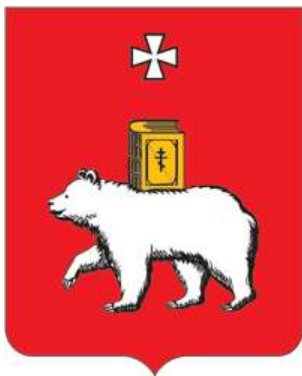
СХЕМА ТЕПЛОСНАБЖЕНИЯ В АДМИНИСТРАТИВНЫХ ГРАНИЦАХ ГОРОДА ПЕРМИ НА ПЕРИОД ДО 2035 ГОДА (АКТУАЛИЗАЦИЯ НА 2020 ГОД)