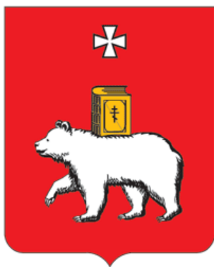
СХЕМА ТЕПЛОСНАБЖЕНИЯ В АДМИНИСТРАТИВНЫХ ГРАНИЦАХ ГОРОДА ПЕРМИ НА ПЕРИОД ДО 2035 ГОДА (АКТУАЛИЗАЦИЯ НА 2020 ГОД)