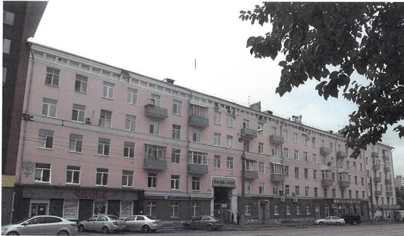
Главный фасад (существующее положение)