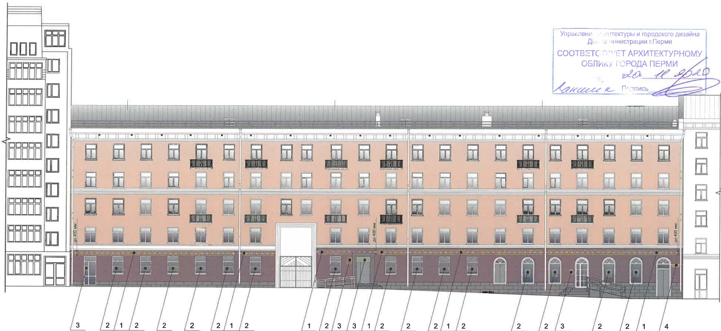
Ведомость средств размещения информации, рекламных конструкций