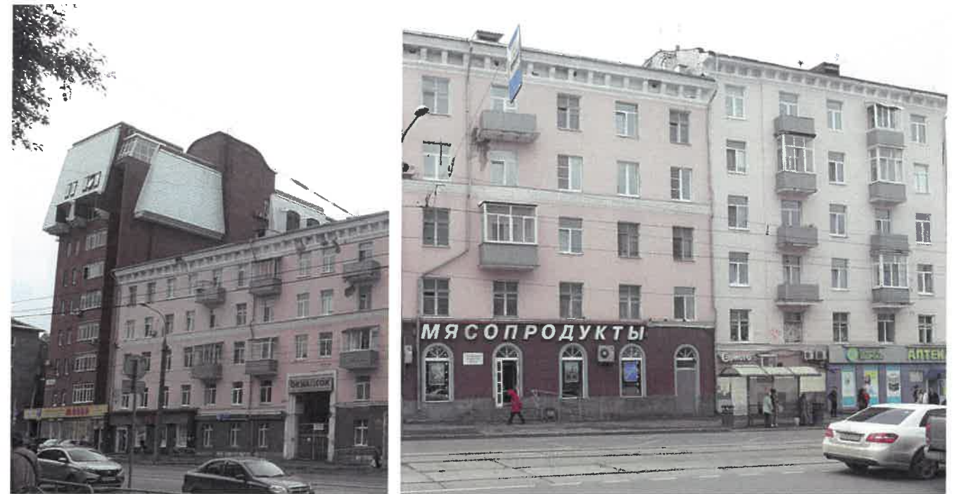
Боковые фасады в осях (существующее положение)