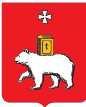
СХЕМА ТЕПЛОСНАБЖЕНИЯ В АДМИНИСТРАТИВНЫХ ГРАНИЦАХ ГОРОДА ПЕРМИ НА ПЕРИОД ДО 2035 ГОДА (АКТУАЛИЗАЦИЯ НА 2021 ГОД)