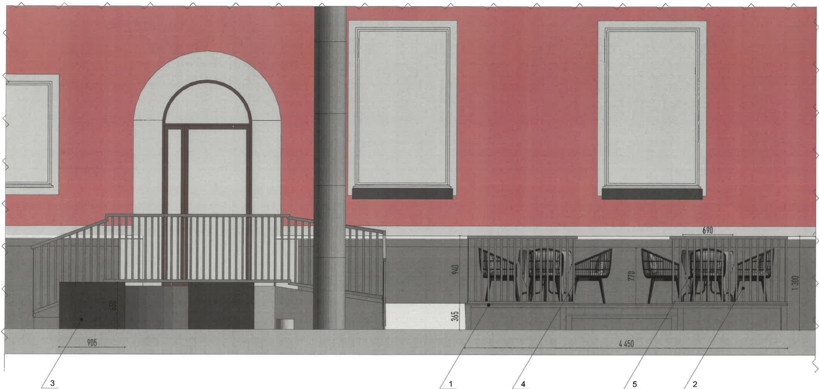
Вид спереди 1:30 (западный фасад)