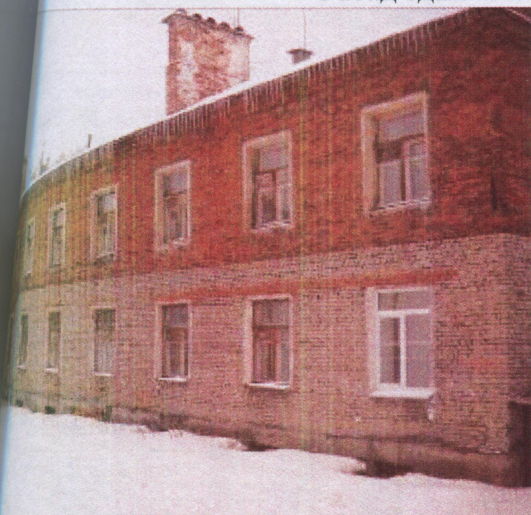
Фасад здания и вход в помещения

Вид встроенных нежилых помещений, общей площадью 181,5 кв. м., в подвале жилого дома, расположенного по адресу: г. Пермь, Свердловский район, ул. Куйбышева, 80/3.