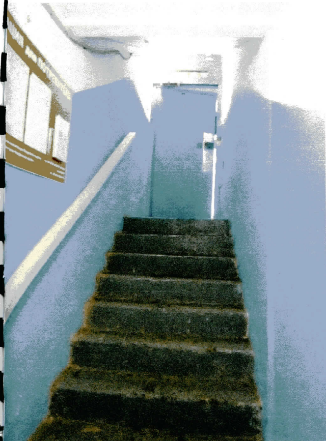
Вход в оцениваемые помещения