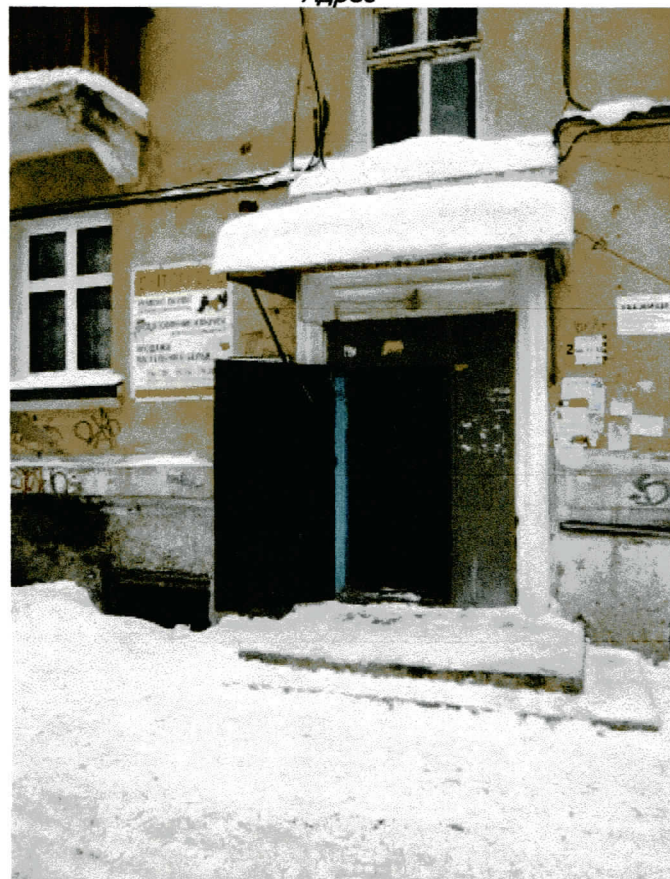
Вход в оцениваемые помещения, совместный вход