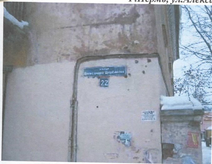
г. Пермь, ул. Александра Щербакова, 22