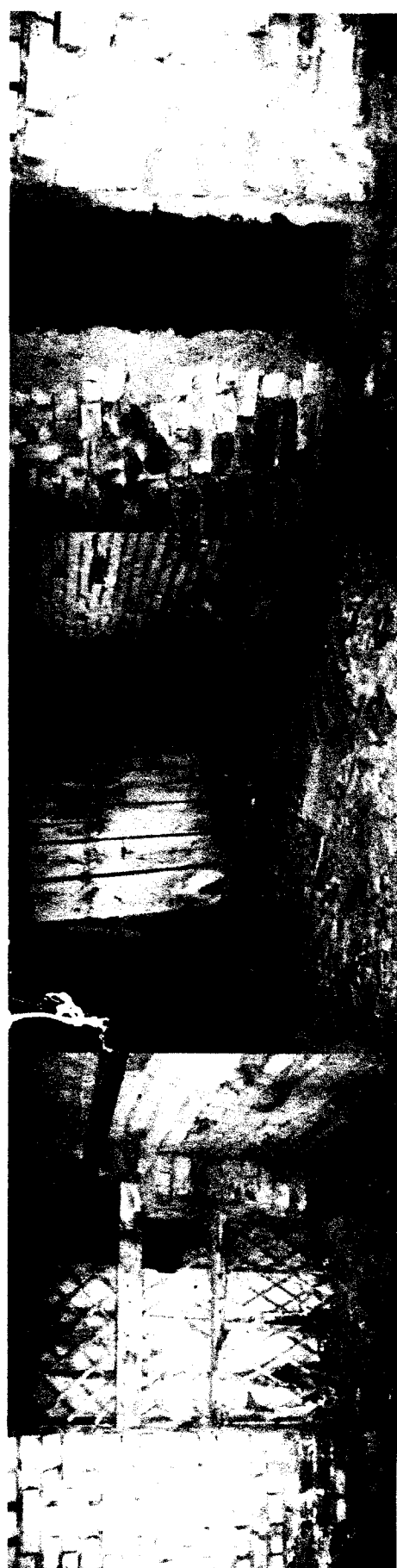
Исполнитель: «Оценочная компания «Тереза»