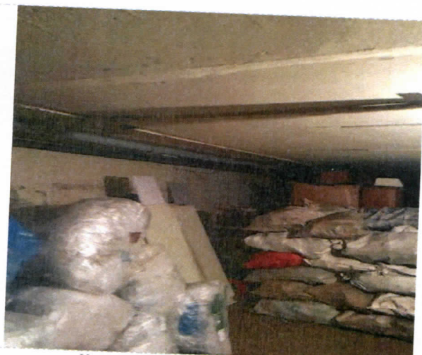
Нежилые помещения, назначение: нежилое, общая площадь 256,5 кв. м., этаж подвал, номера на поэтажном плане 2,3,4,6,7,8,9,10, адрес объекта: Пермский край, г. Пермь, Орджоникидзевский район, ул. Качканарская, д.45