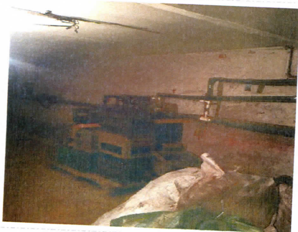
Нежилые помещения, назначение: нежилое, общая площадь 256,5 кв. м., этаж подвал, номера на поэтажном плане 2,3,4,6,7,8,9,10, адрес объекта: Пермский край, г. Пермь, Орджоникидзевский район, ул. Качканарская, д.45