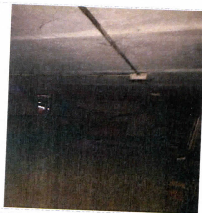
Нежилые помещения, назначение: нежилое, общая площадь 256,5 кв. м., этаж подвал, номера на поэтажном плане 2,3,4,6,7,8,9,10, адрес объекта: Пермский край, г. Пермь, Орджоникидзевский район, ул. Качканарская, д.45