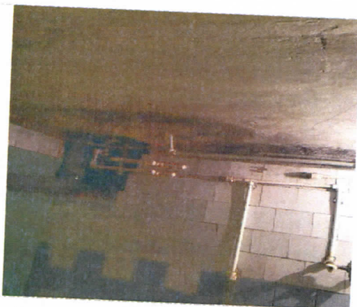
Нежилые помещения, назначение: нежилое, общая площадь 256,5 кв. м., этаж подвал, номера на поэтажном плане 2,3,4,6,7,8,9,10, адрес объекта: Пермский край, г. Пермь, Орджоникидзевский район, ул. Качканарская, д.45