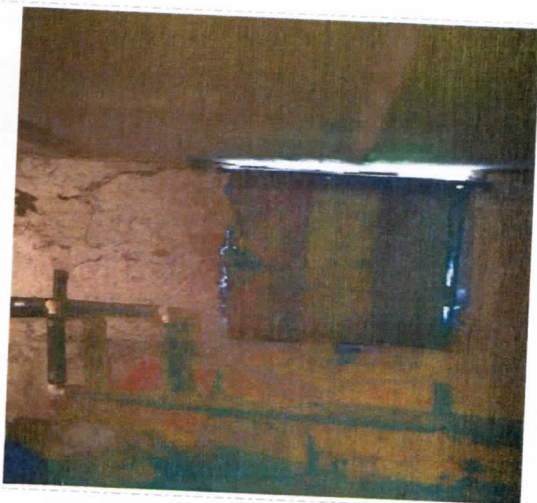
Нежилые помещения, назначение: нежилое, общая площадь 256,5 кв. м., этаж подвал, номера на поэтажном плане 2,3,4,6,7,8,9,10, адрес объекта: Пермский край, г. Пермь, Орджоникидзевский район, ул. Качканарская, д.45