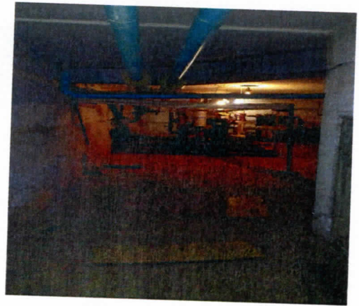
Нежилые помещения, назначение: нежилое, общая площадь 197,7 кв. м., этаж подвал, номера на поэтажном плане 1,2,3,4,5,6,7,8,9,10,11,12, адрес объекта: Пермский край, г. Пермь, Орджоникидзевский район, ул. Генерала Черныховского, д.72а