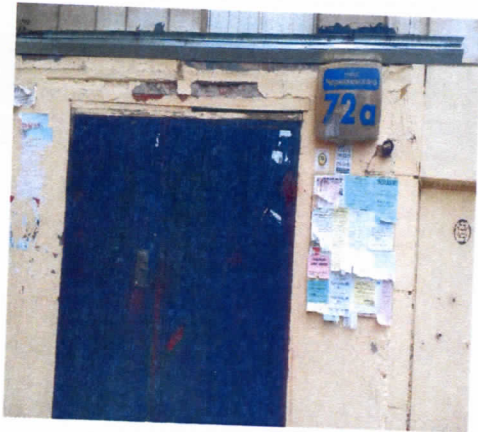
Нежилые помещения, назначение: нежилое, общая площадь 197,7 кв. м., этаж подвал, номера на поэтажном плане 1,2,3,4,5,6,7,8,9,10,11,12, адрес объекта: Пермский край, г. Пермь, Орджоникидзевский район, ул. Генерала Черныховского, д.72а