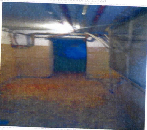
Нежилые помещения, назначение: нежилое, общая площадь 197,7 кв. м., этаж подвал, номера на поэтажном плане 1,2,3,4,5,6,7,8,9,10,11,12, адрес объекта: Пермский край, г. Пермь, Орджоникидзевский район, ул. Генерала Черныховского, д.72а