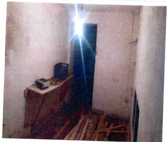
Нежилые помещения, назначение: нежилое, общая площадь 197,7 кв. м., этаж подвал, номера на поэтажном плане 1,2,3,4,5,6,7,8,9,10,11,12, адрес объекта: Пермский край, г. Пермь, Орджоникидзевский район, ул. Генерала Черныховского, д.72а