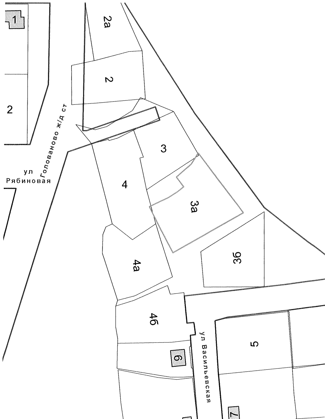
Схема местоположения объекта адресации

Приложение к распоряжению начальника департамента градостроительства и архитектуры администрации города Перми от 22.10.2018 № СЭД-059-22-01-03-639