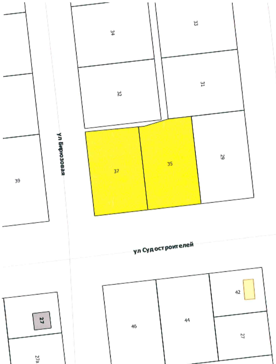
Схема местоположения объектов адресации

Приложение к распоряжению начальника департамента градостроительства и архитектуры администрации города Перми от 12.11.2018 № СЭД-059-22-01-03-773