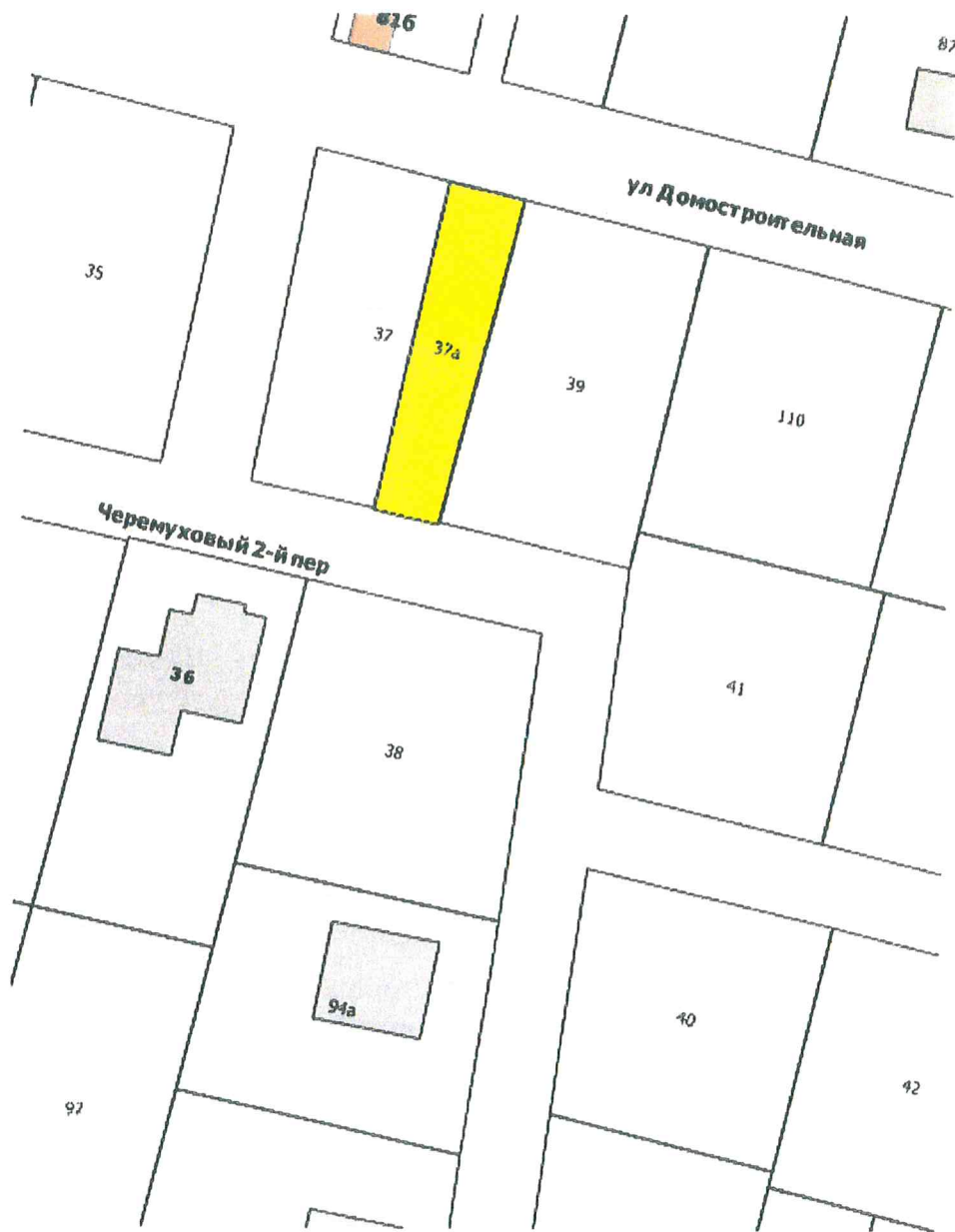
Схема местоположения объектов адресации

Приложение к распоряжению начальника департамента градостроительства и архитектуры администрации города Перми от 18.01.2019 № СЭД-059-22-01-03-70