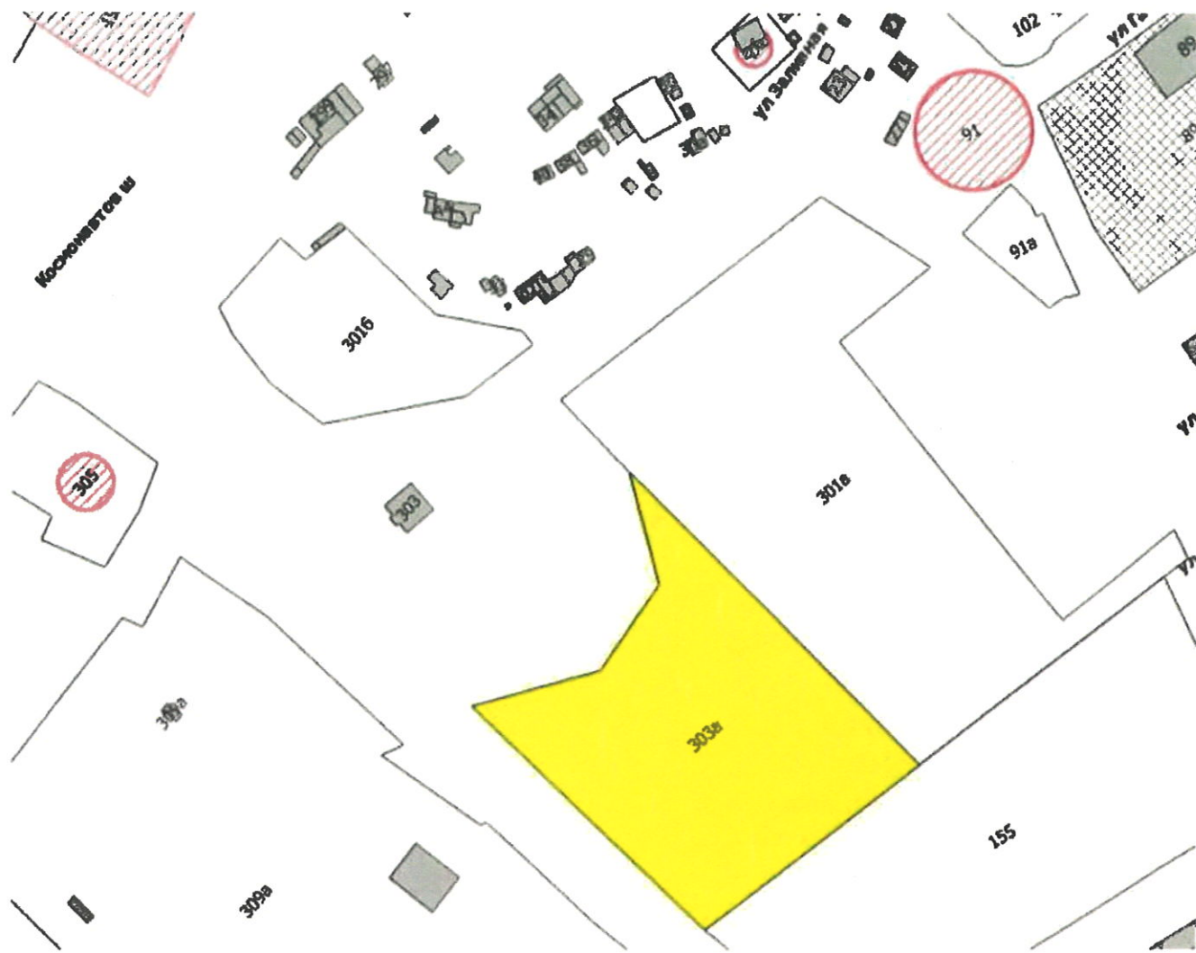
Схема местоположения объекта адресации