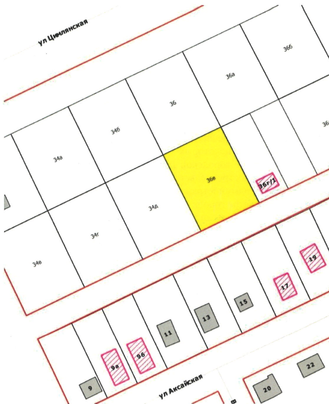
Схема местоположения объекта адресации