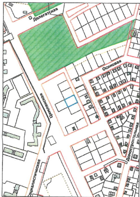
Ситуационный план расположения земельного участка 1:5000