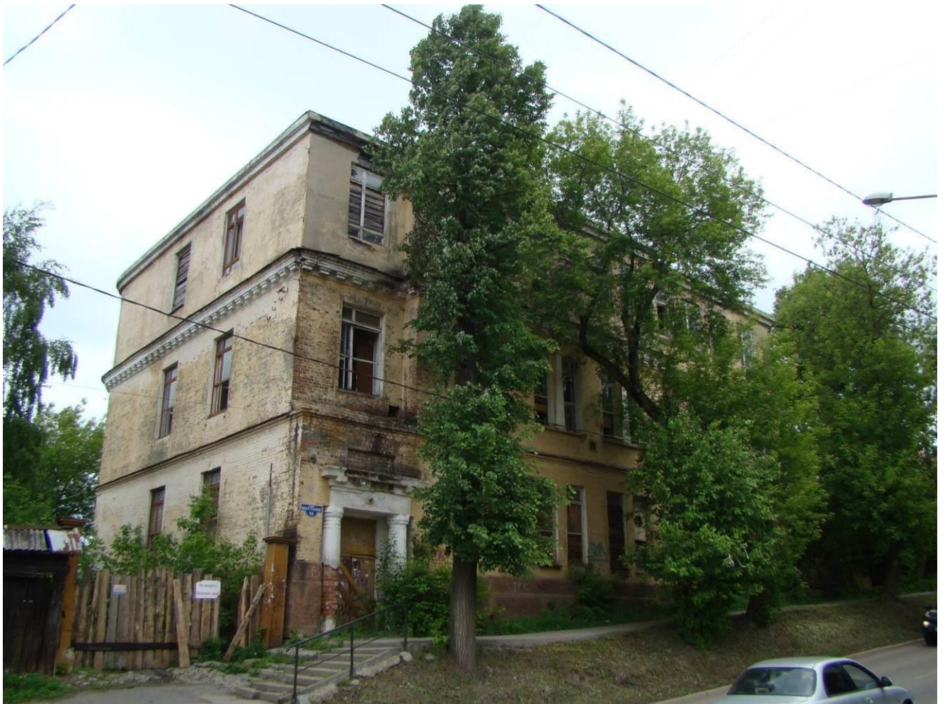
Общий вид с северо-запада. Фото 07.06.2019 г.

Приложение к охранному обязательству собственника или иного законного владельца объекта культурного наследия, включенного в единый государственный реестр объектов культурного наследия (памятников истории и культуры) народов Российской Федерации, «Здание школы, где учились семь Героев Советского Союза», 1913 г., расположенного по адресу: Пермский край, Пермский городской округ, г. Пермь, ул. Восстания, д. 55