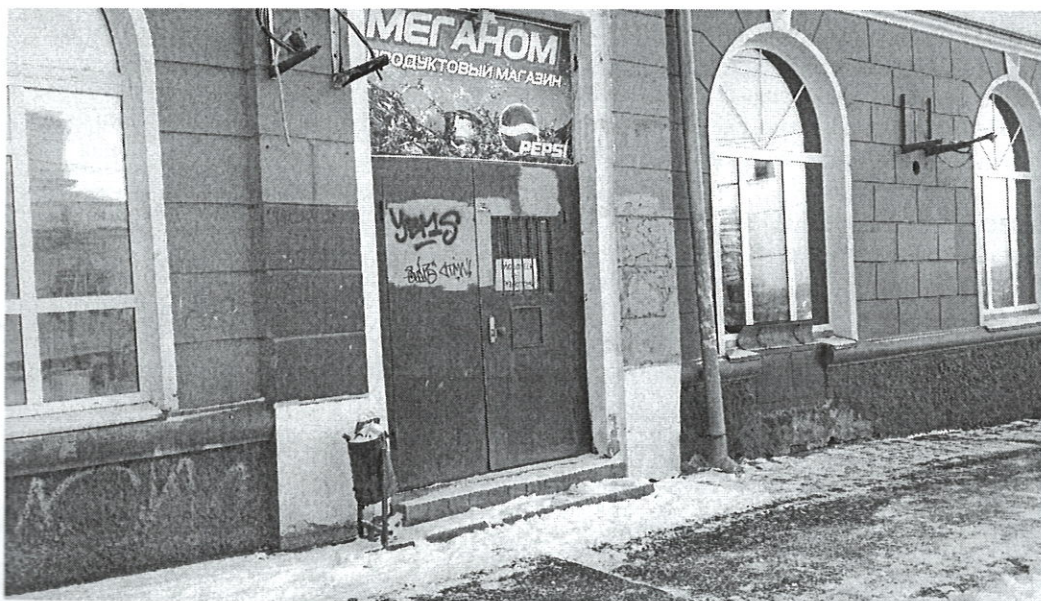
Изображение 10.4 Вид на входную группу