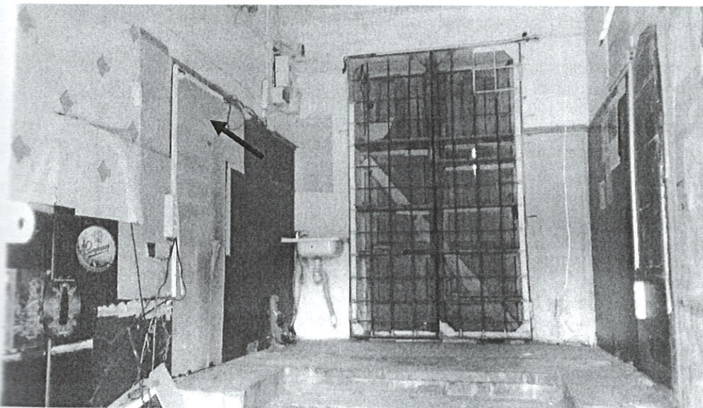
Изображение 10.5 Внутреннее помещение