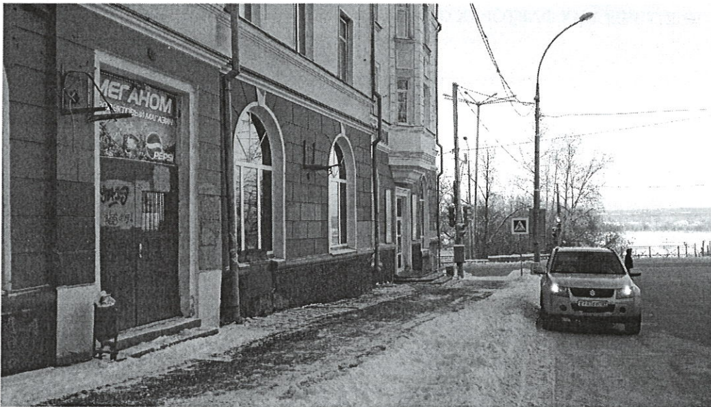
Изображение 10.3 Вид на здание с прилегающей улицы

текущего ремонта отделки. Фотографии объект приведены на изображениях 10.3 – 10.5.