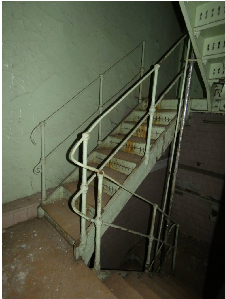
Интерьеры. 2 этаж. Помещение № 2. Лестница в ректификационную башню.