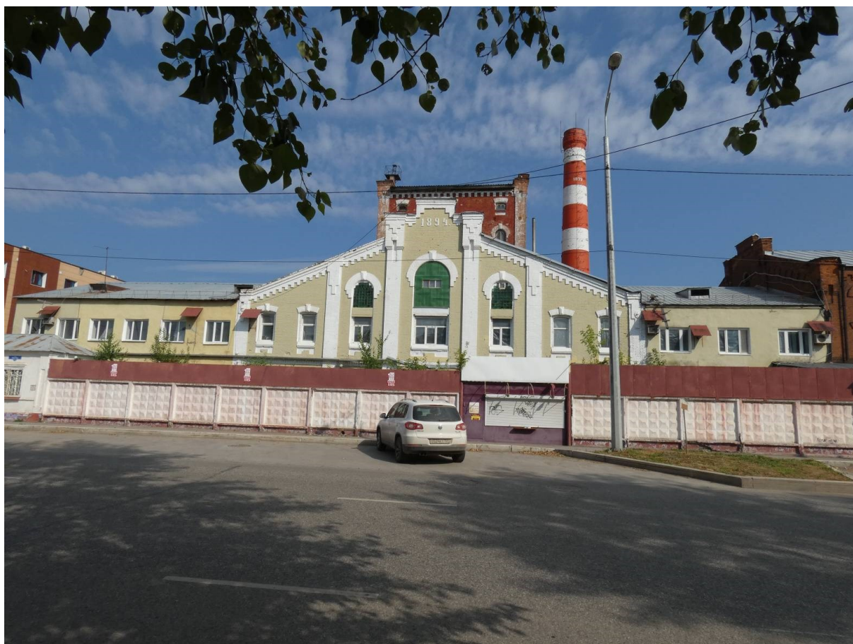
Южный (главный) фасад.