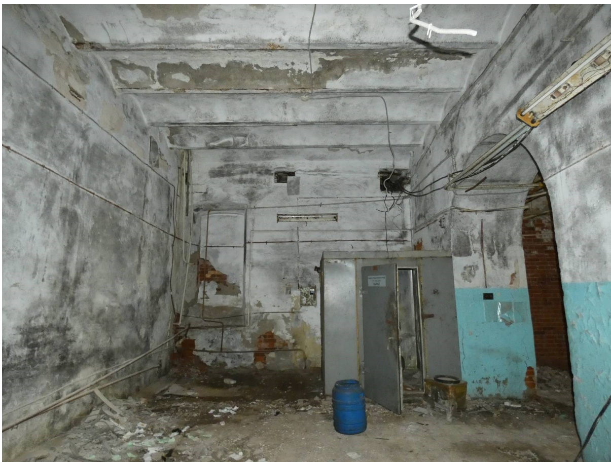
Интерьеры. 1 этаж. Помещение № 32: арочный проем, перекрытие сводиками по металлическим балкам.