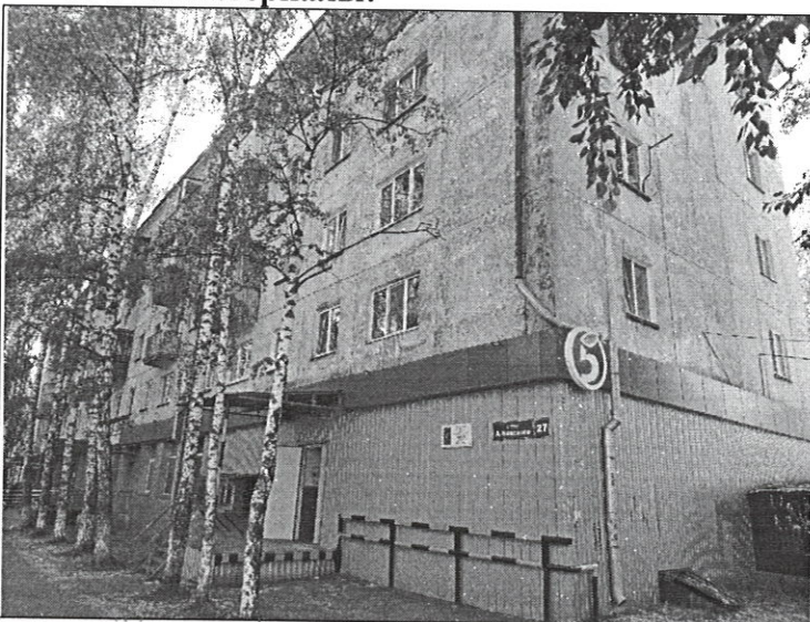
ул. Александра Невского, д. 27