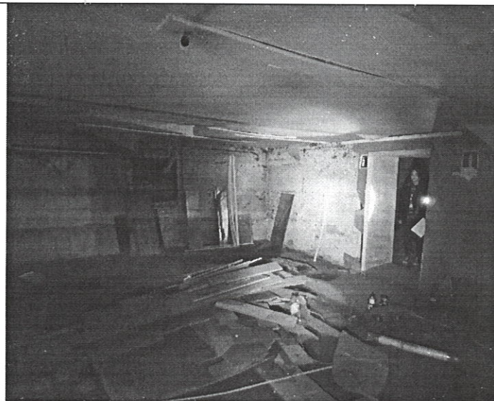
Помещение № 38