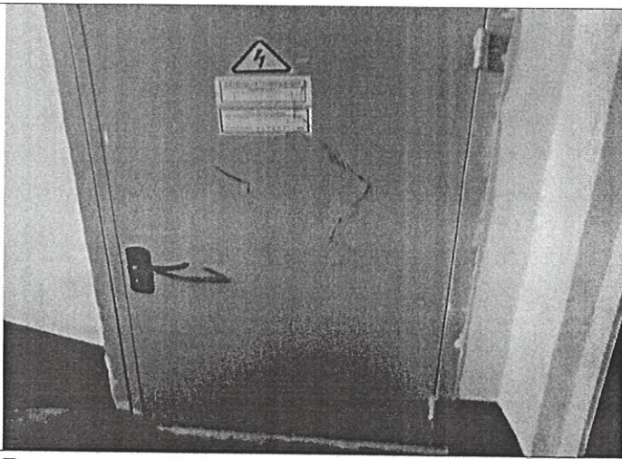
Вход в пом. № 1