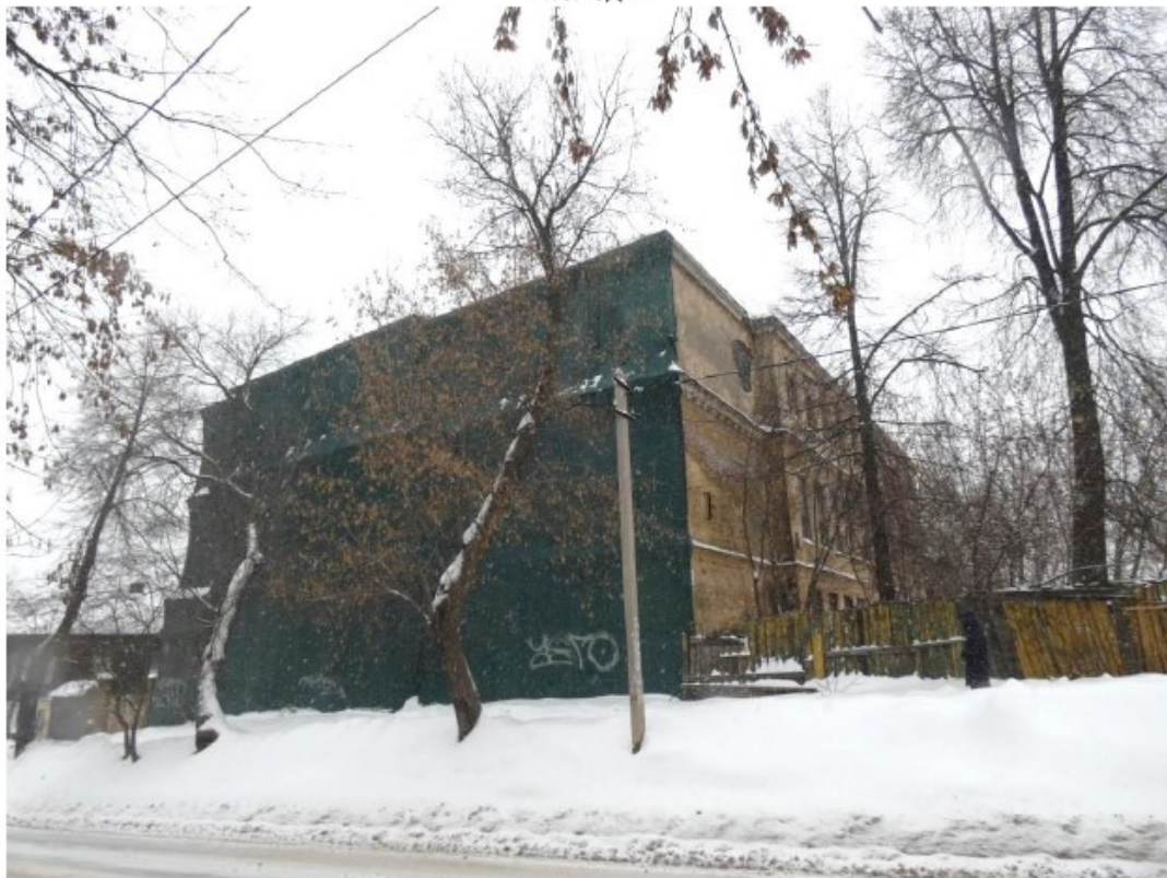
Общий вид с юго-запада.