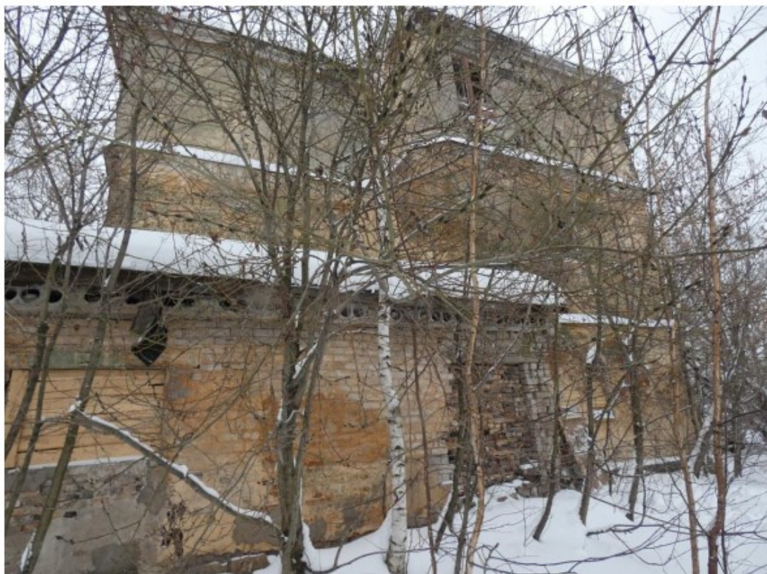
Фрагмент восточного фасада.