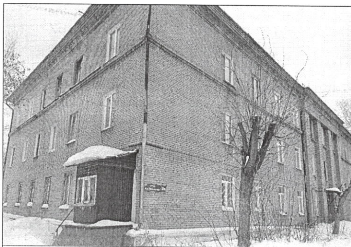
ул. 4-й Пятилетки, д. 2а