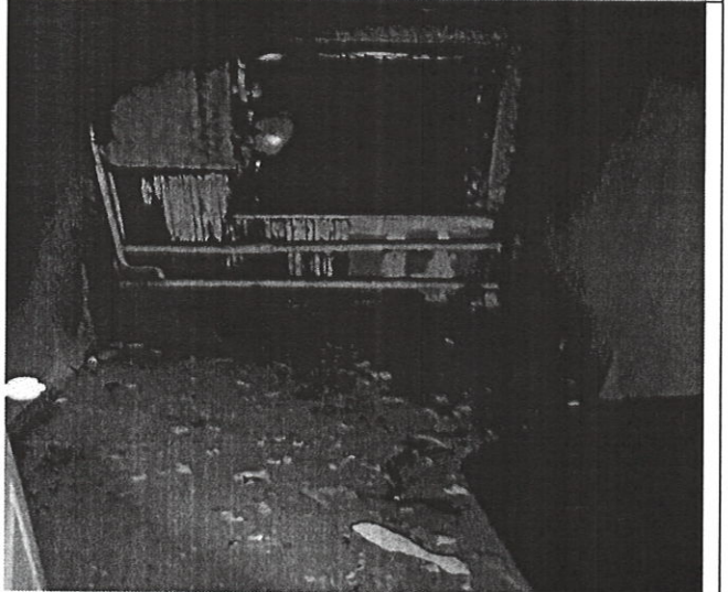
Вход в цокольный этаж