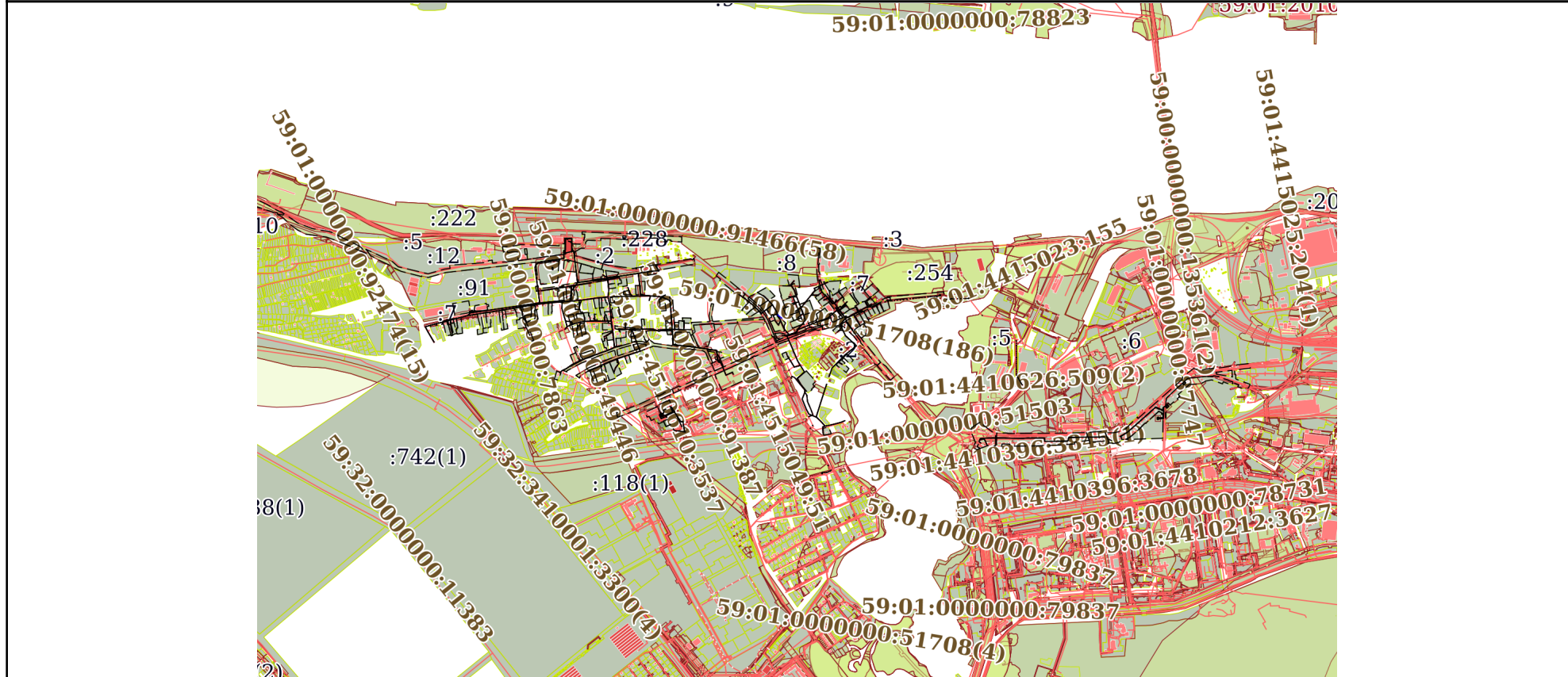
Схема расположения объекта недвижимости (части объекта недвижимости) на земельном участке(ах)