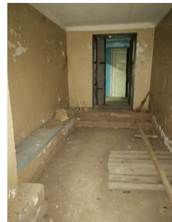
Лот № 6