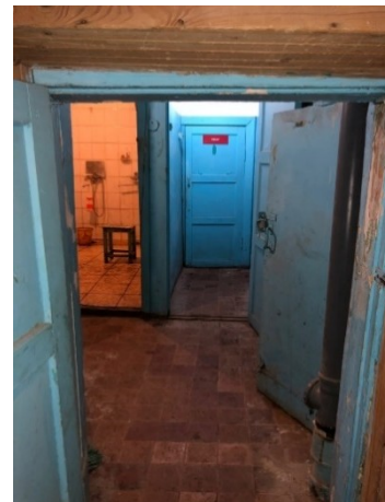
Лот № 5