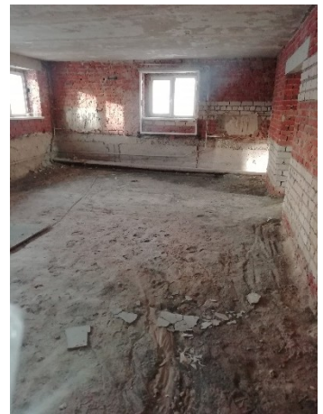
Лот № 10