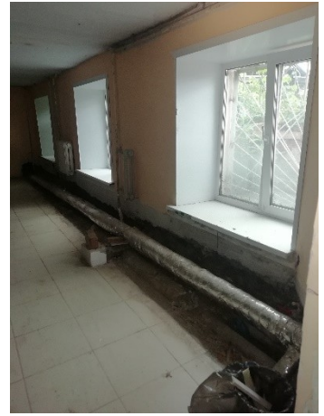
Лот № 9