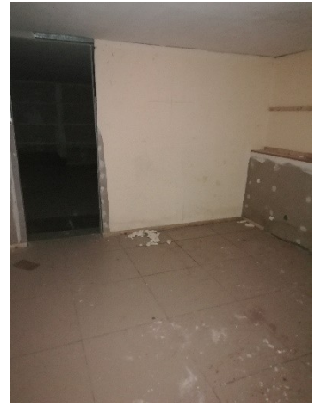
Лот № 11