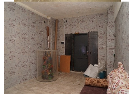
Лот № 7