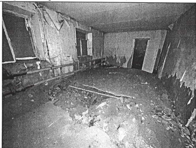
Пом. № 9 ТП от 16.12.2008