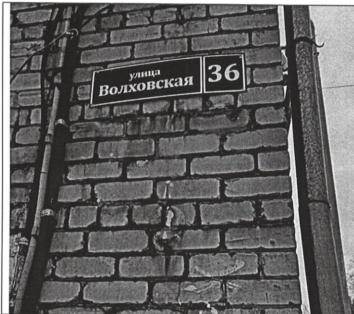
Адресная привязка объекта