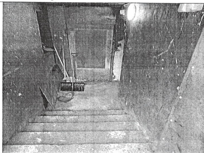
Вход в цокольный этаж