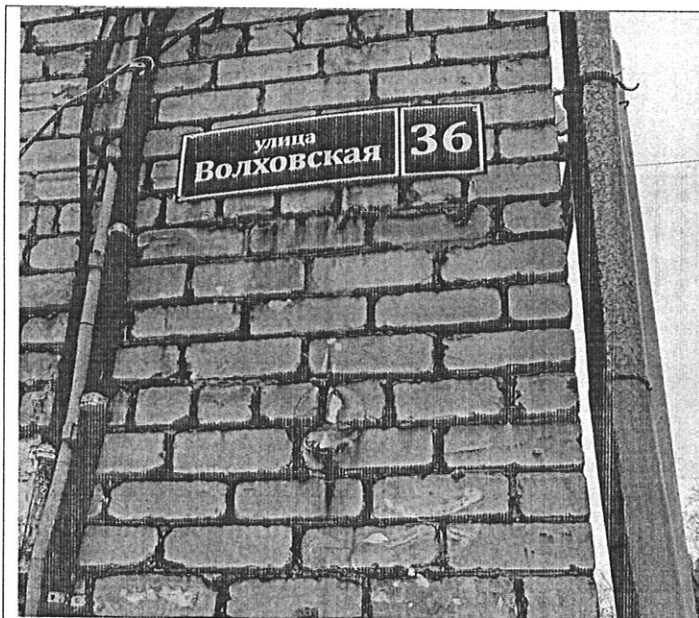
Адресная привязка объекта