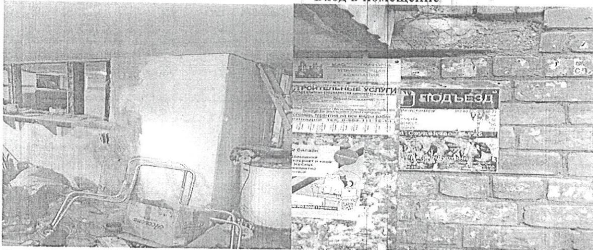
Пом. № 2