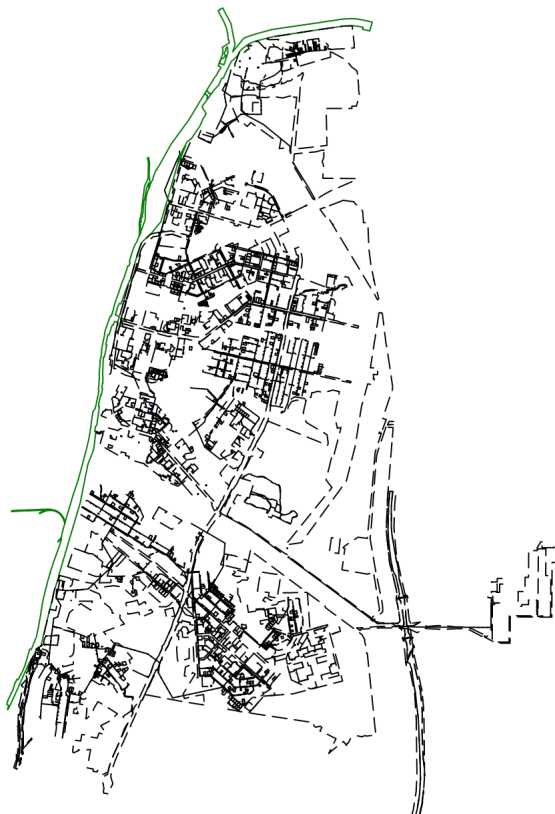
Схема расположения объекта недвижимости (части объекта недвижимости) на земельном участке(ах)