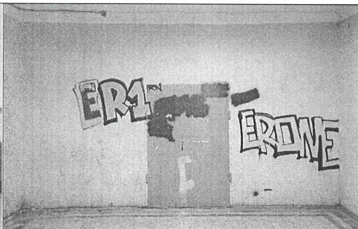
Вход на объект