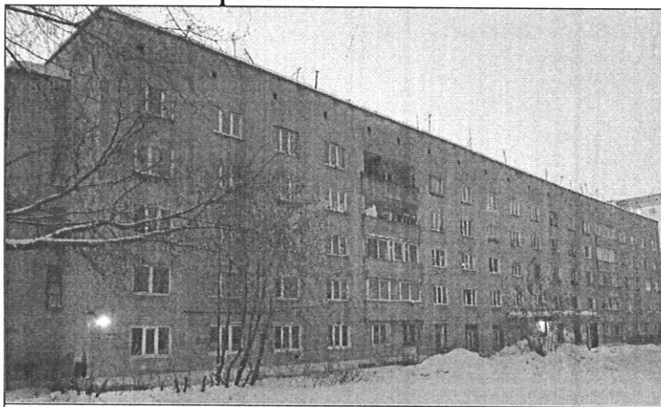
ул. Танцорова, 27