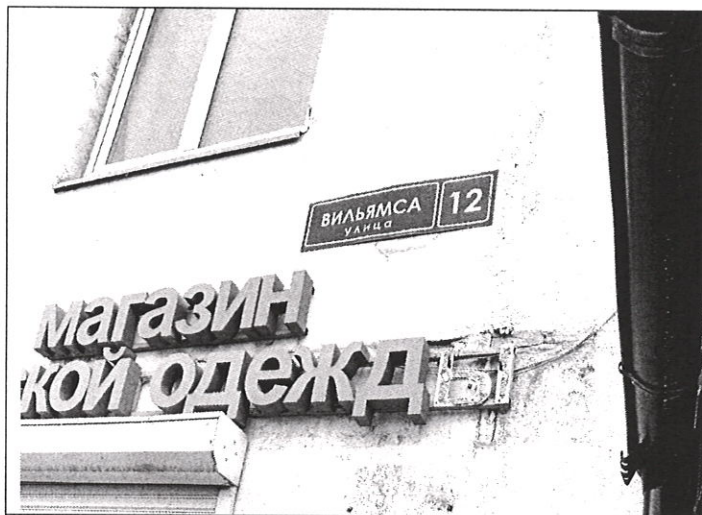
Адресная привязка объекта