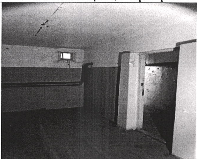
Пом. № 21 по ТП от 23.12.2024