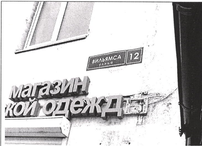
Адресная привязка объекта