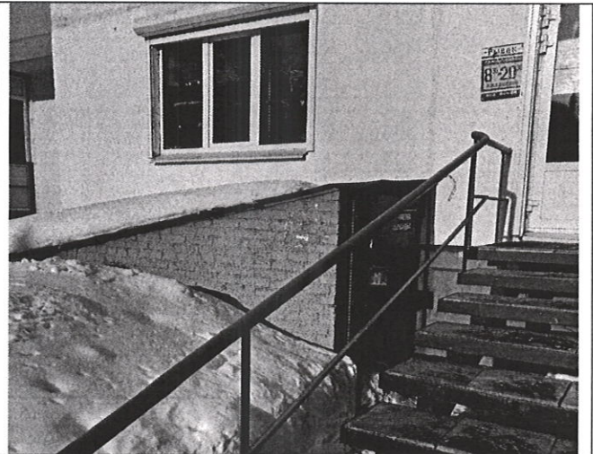
Вход в помещение с улицы через приямок