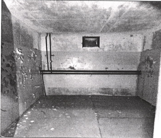
Пом. № 26 по ТП от 23.12.2024