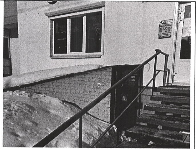
Вход в помещение с улицы через приямок