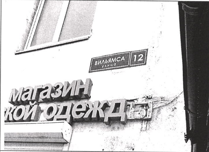
Адресная привязка объекта