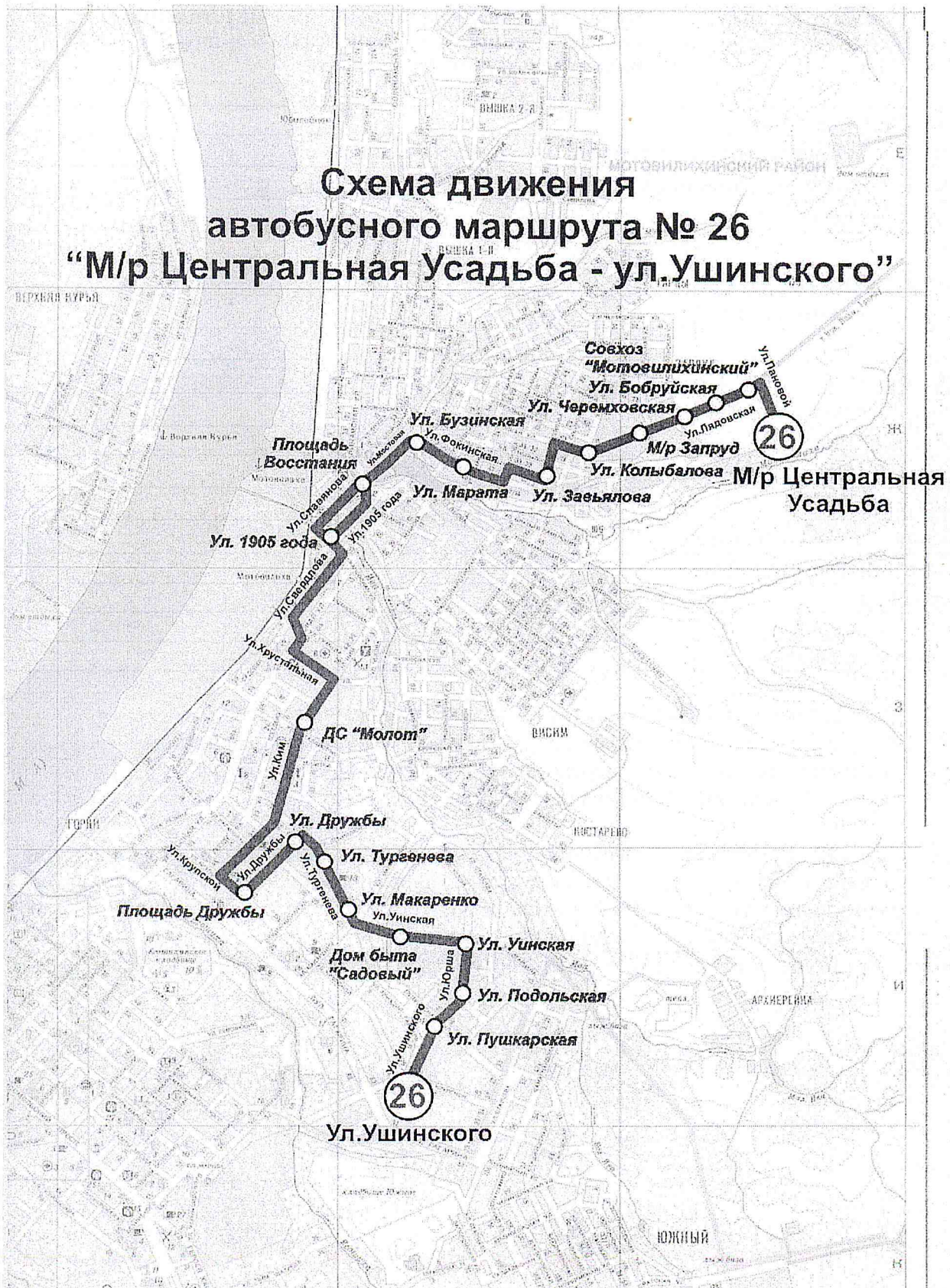
Схема движения автобусного маршрута № 26 “М/р Центральная Усадьба - ул.Ушинского”