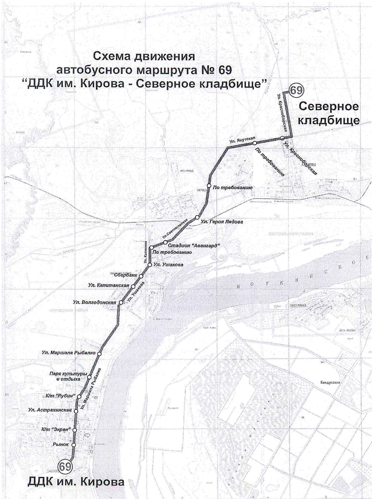
Схема движения автобусного маршрута № 69 “ДДК им. Кирова - Северное кладбище”