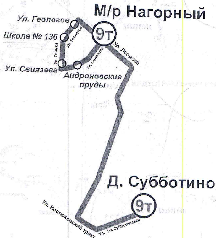
Схема движения автобусного маршрута № 9Т “Субботино - микрорайон Нагорный”