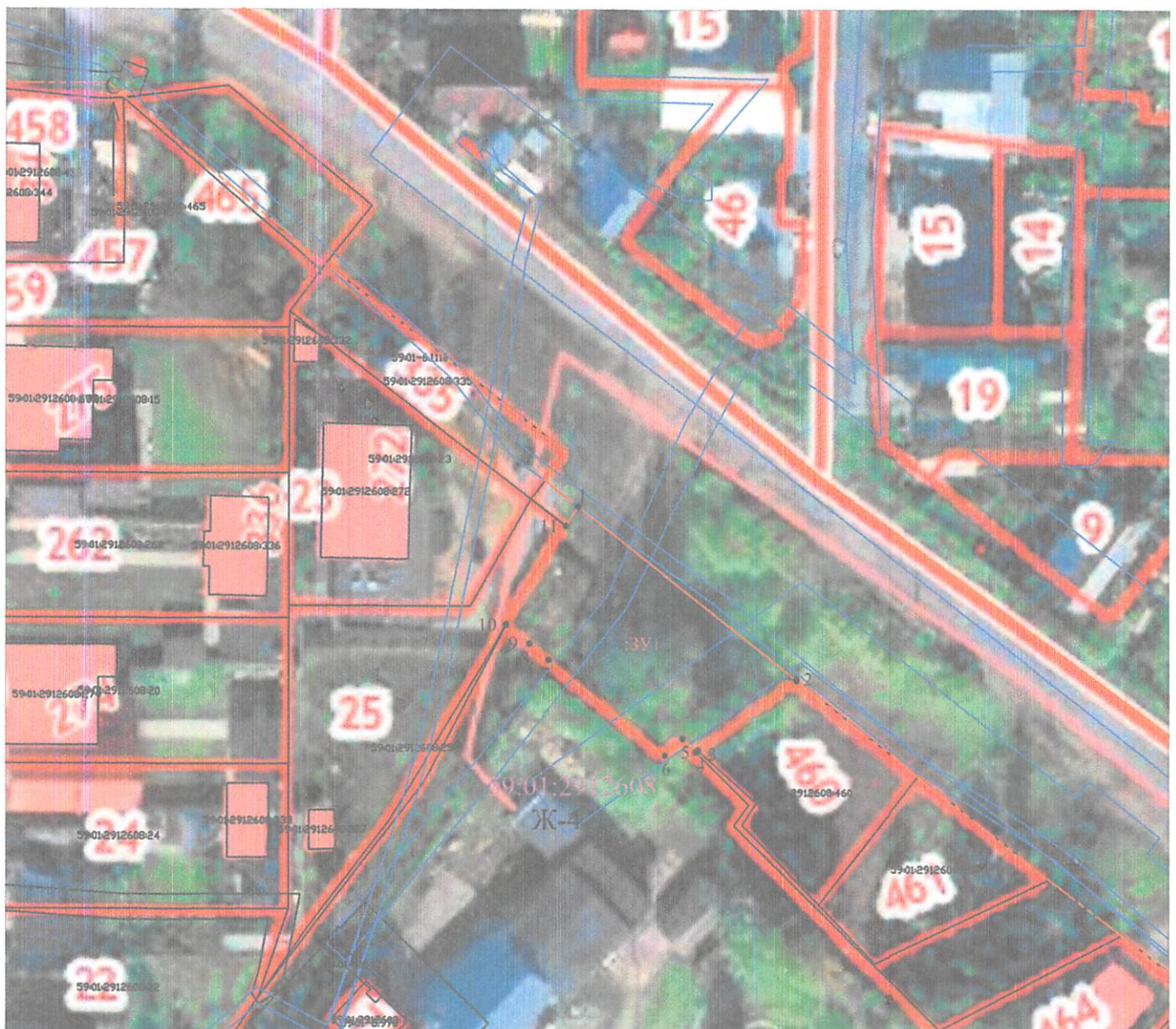
Схема расположения земельного участка или земельных участков на кадастровом плане территории