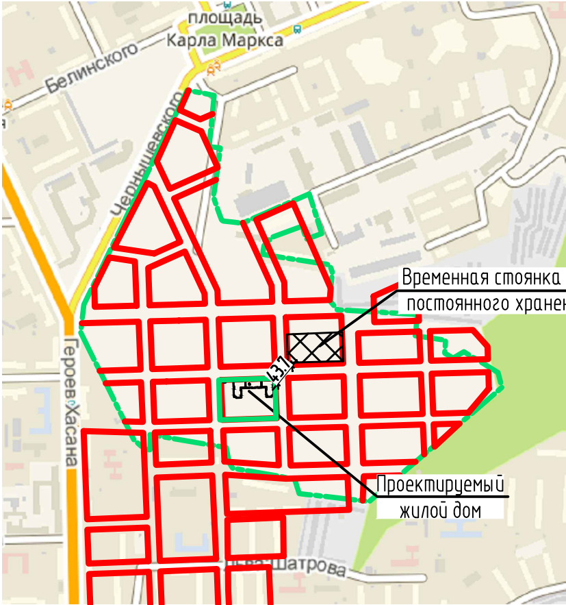
Ситуационный план М 1:10000