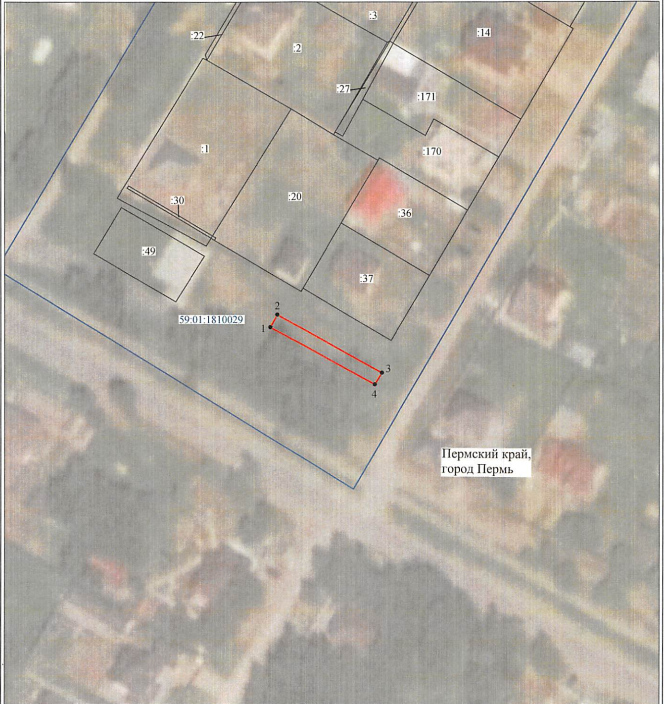
Схема расположения границ публичного сервитута объекта