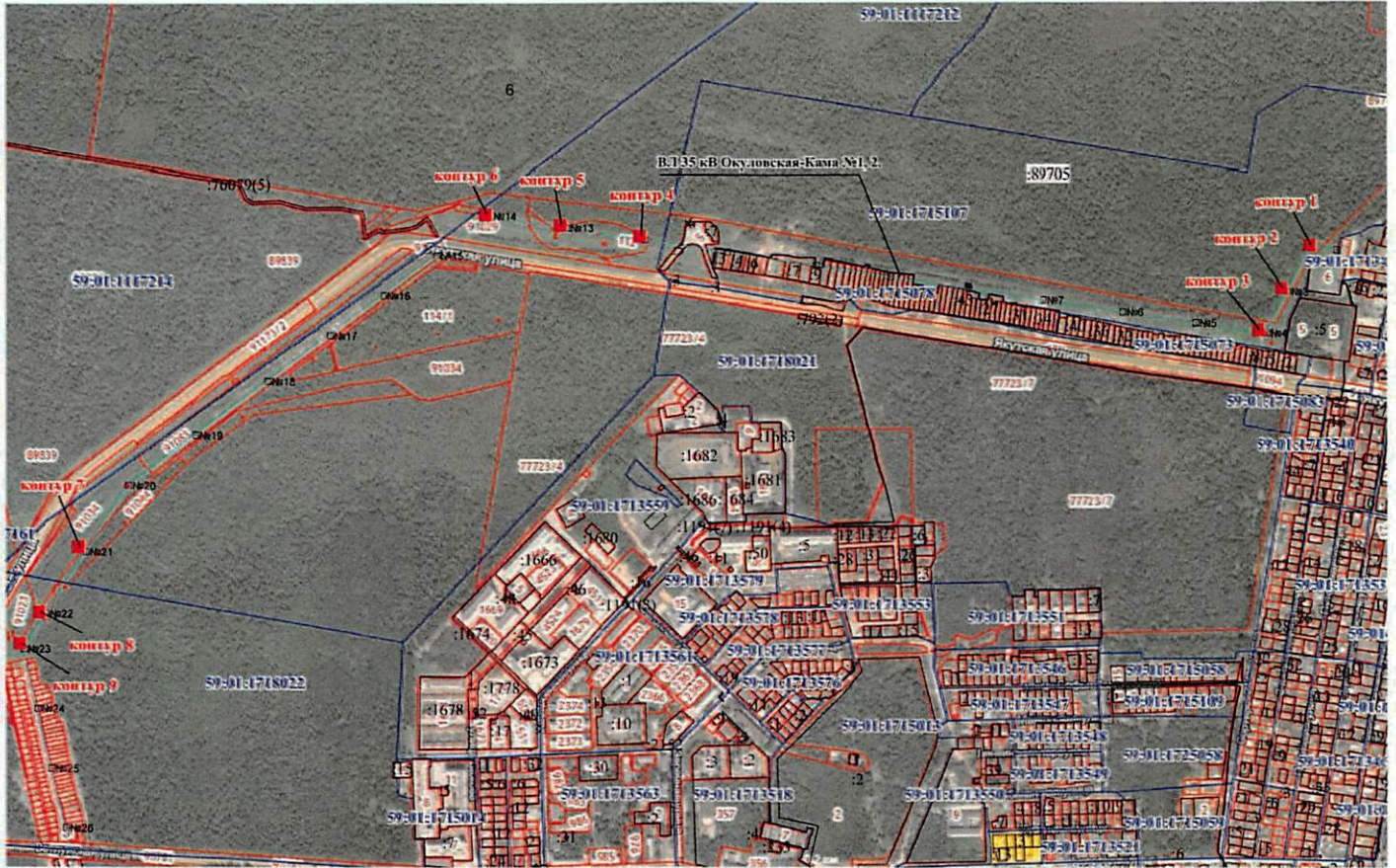
Масштаб 1:12 000

Объект: ВЛ 35 кВ Окуловская-Кама №1, 2. Местоположение: Пермский край, г. Пермь, Орджоникидзевский район Площадь земель и/или части земельного участка, кв.м.: 265 Категория земель: земли населённых пунктов