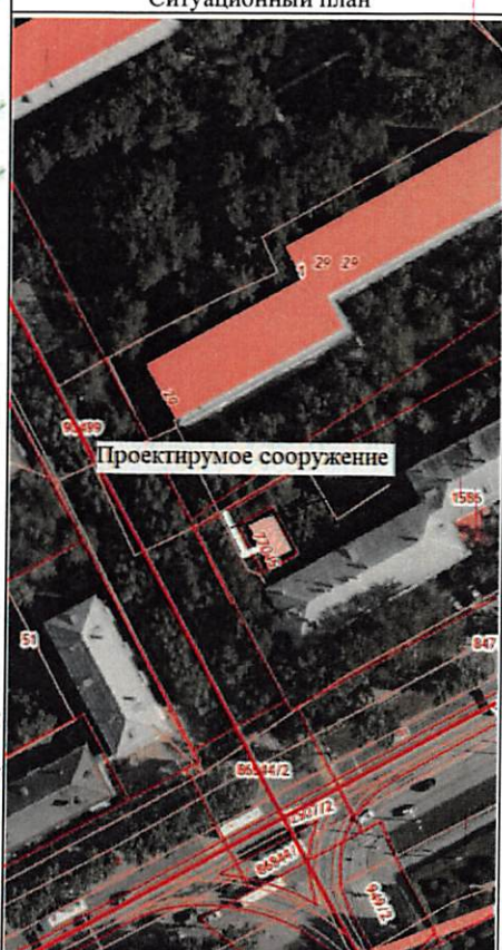
Масштаб 1: 500