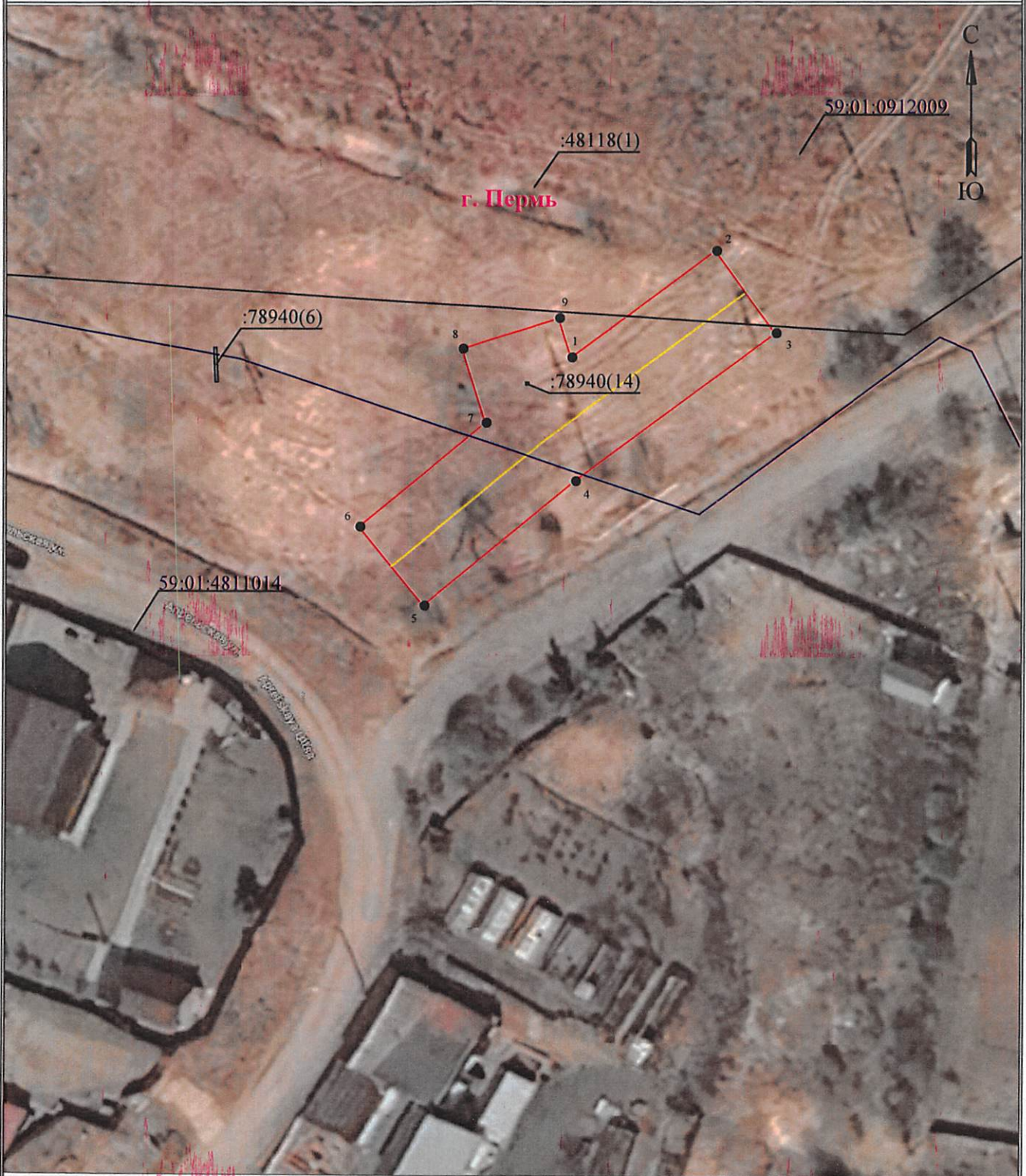
Схема расположения границ публичного сервитута для эксплуатации объекта электросетевого хозяйства ВЛ-10кВ ф.Броды с ПС Сафроны (наименование объекта)

Используемые условные знаки и обозначения: