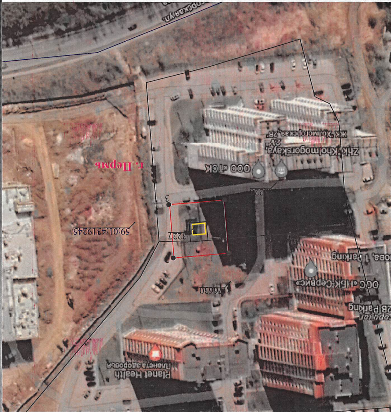
План границ объекта