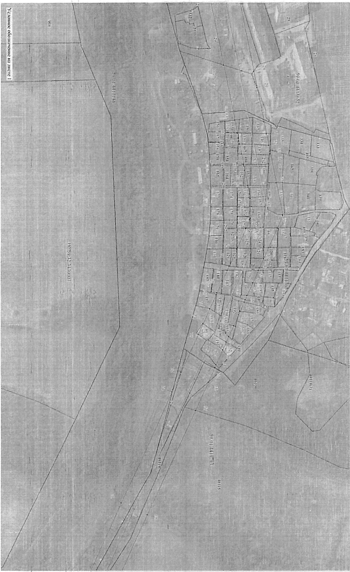
Дяст 3 на дястона 4