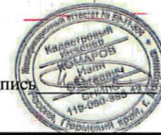
Схема № 5Л

Заявитель: ООО «СОТА» Подпись _____ дата «27» апреля 2024г.